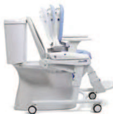
ÁNGULO DEL RESPALDO AJUSTABLE

Hts es una unidad de asiento multifuncional, es ajustable y cuenta con una amplia gama de accesorios. Se puede utilizar tanto en el baño como en la ducha.