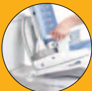
INSTALACIÓN EN WC