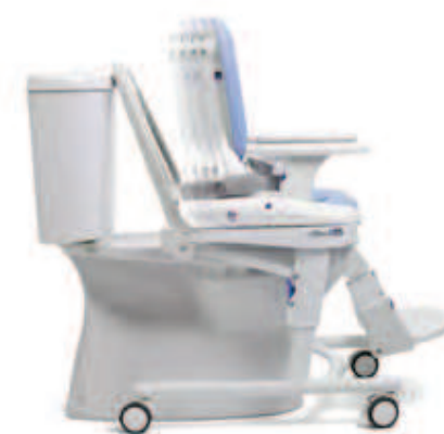
PROFUNDIDAD DE ASIENTO AJUSTABLE