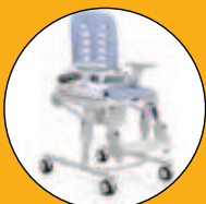
BASE CON RUEDAS