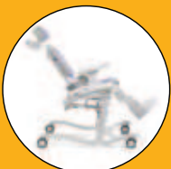
BASE CON RUEDAS BASCULANTE