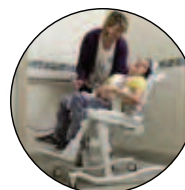
SISTEMA PARA LA DUCHA