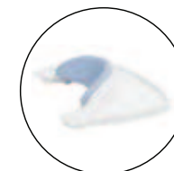
SOPORTE ANTERIOR MESA